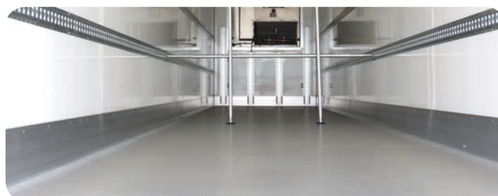
Pianale in alluminio, zoccolo in alluminio e rail fermacarico