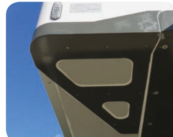
Opzione rinforzo angolare anteriore per nave