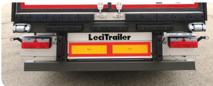
Opzione posteriore con paraurti in acciaio skid-ship