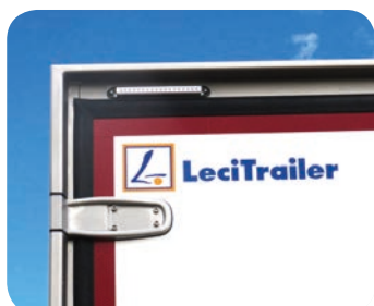
Portale in acciaio Inox e luci di ingombro sequenziali 3 posizioni