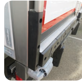
Tampone laterale verticale e tamponi coperti in lastra