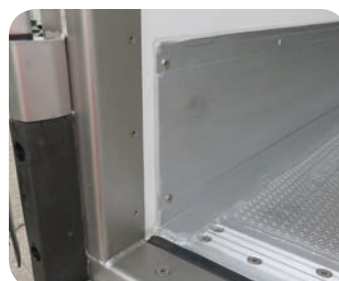
Gomma rottura ponte termico e profilo in alluminio transizione a pianale