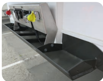
Supporto connessioni Inox e fermo anteriore di protezione XLarge rinforzato