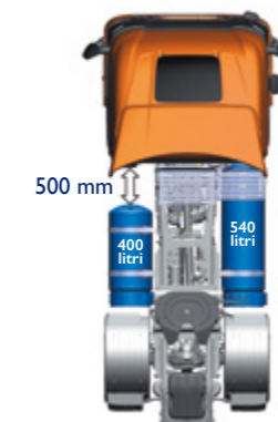
LNG - Fino a 1.400 km