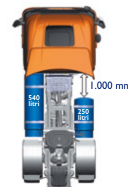
LNG - Fino a 1.150 km