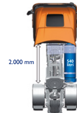
LNG - Fino a 800 km