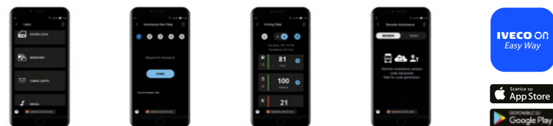
Gestione della cabina IVECO Assistance Non-Stop Assistente alla guida Servizio di assistenza a distanza

Controlla le funzionalità della cabina e del veicolo direttamente dal tuo smartphone: Driving Style Evaluation, servizio di assistenza da remoto, Over-the-air update e controllo della cabina, tutto a portata di mano. Ora con l'integrazione di IVECO DRIVER PAL potrai accedere facilmente alle Skill MYIVECO e MYCOMMUNITY. Notifiche push ti aggiorneranno sullo stato del veicolo, e con un semplice QR code potrai accoppiare il tuo telefono con il veicolo.