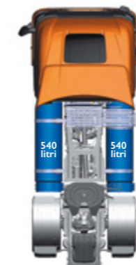
LNG - Fino a 1.600 km

I serbatoi sono disponibili in versione CNG o LNG e sono realizzati su misura per liberare lo spazio necessario sul telaio per la tua missione, con un'autonomia fino a 1.600 km.