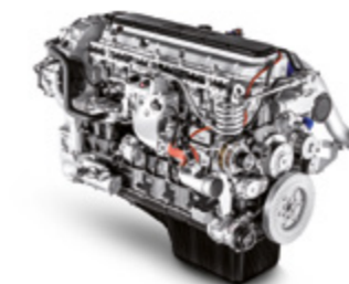
Cursor 13 Natural Gas