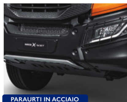
PARAURTI IN ACCIAIO