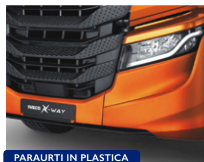
PARAURTI IN PLASTICA