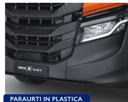
PARAURTI IN PLASTICA