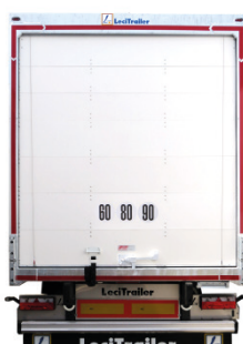
Porta a serranda