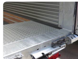
Lamiera di protezione per accesso carrelli