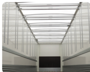
Opzione doppio piano e tetto in poliestere.