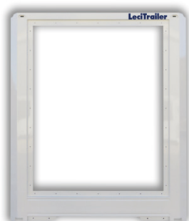
Parete anteriore: struttura monoblocco galvanizzata e in cataforesi KTL