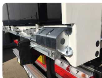
Angolari di protezione